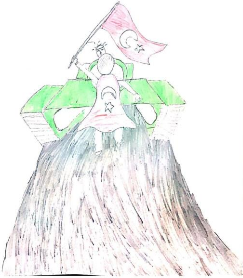
Nehir SEPETÇİ 3/A