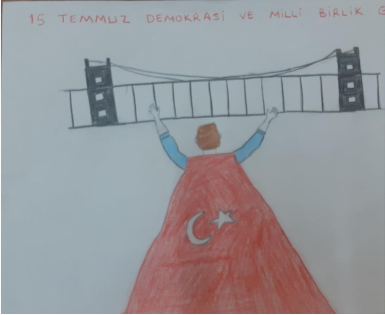
Ecrin KAYAURUN 4/A