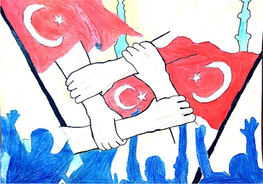
Selin ATAŞ 3/A