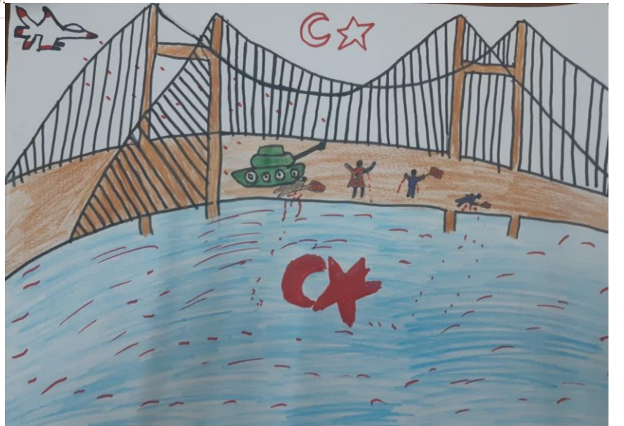
Emre SAYIN 4/A