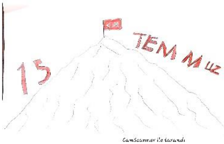
Duru SEPETÇİ 3/A